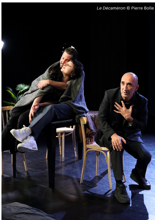
Le Décaméron © Pierre Bolle

Le Décaméron, œuvre gigantesque et généreuse, ne cesse de faire écho dans nos mémoires au plus près de notre Histoire. Boccaccio y dénonce l'aliénation au religieux, la perversion du pouvoir et y revendique la liberté du désir et le droit à la jouissance terrestre.