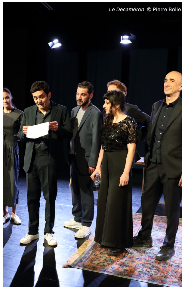
Le Décaméron © Pierre Bolle

L'Infini Théâtre, toujours au plus près des êtres, choisit de livrer avec jubilation ces contes d'hier comme s'ils survenaient aujourd'hui. Ce théâtre authentique avoue son besoin de recréer du lien et de nous emporter au cœur de nous-mêmes par une mise en jeu moderne, sans artifice qui proclame le courage des idées et l'urgence de partager la culture !